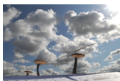
Ling Zhi Helikopters by Huang Yong Ping.png