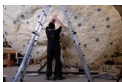
Ling Zhi Helicopters in wording_foto Wineke van Muiswinkel no3.jpg