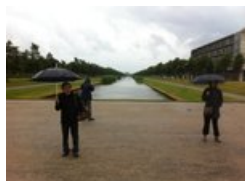
Huang Yong Ping in Ypenburg.JPG