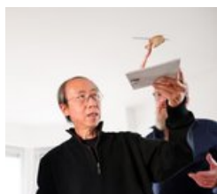
Ling Zhi Helicopters en Huang Yong Ping_uitsnede.jpg