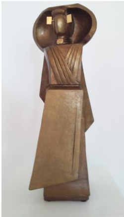
Zeeuws meisje - Cor Guldenmund (2018)

andere speelt het als basisvaardigheid een rol. In de cursus Modeltekenen wordt gewerkt naar levend model. Dit geldt ook voor de cursus Portrettekenen. Hoewel de nadruk ligt op tekenen kan een deel van de cursus gebruikt worden voor het schilderen naar portret en model.