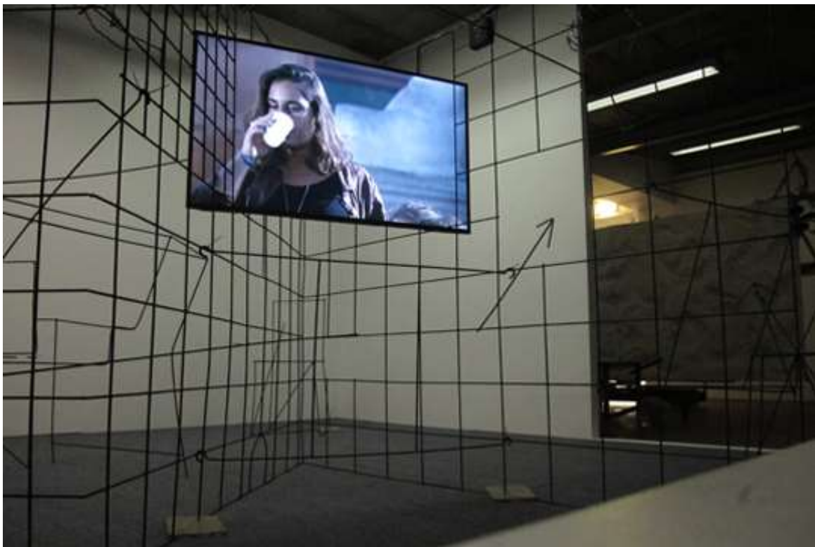
Tentoonstelling Neil Beloufa, Counting on People