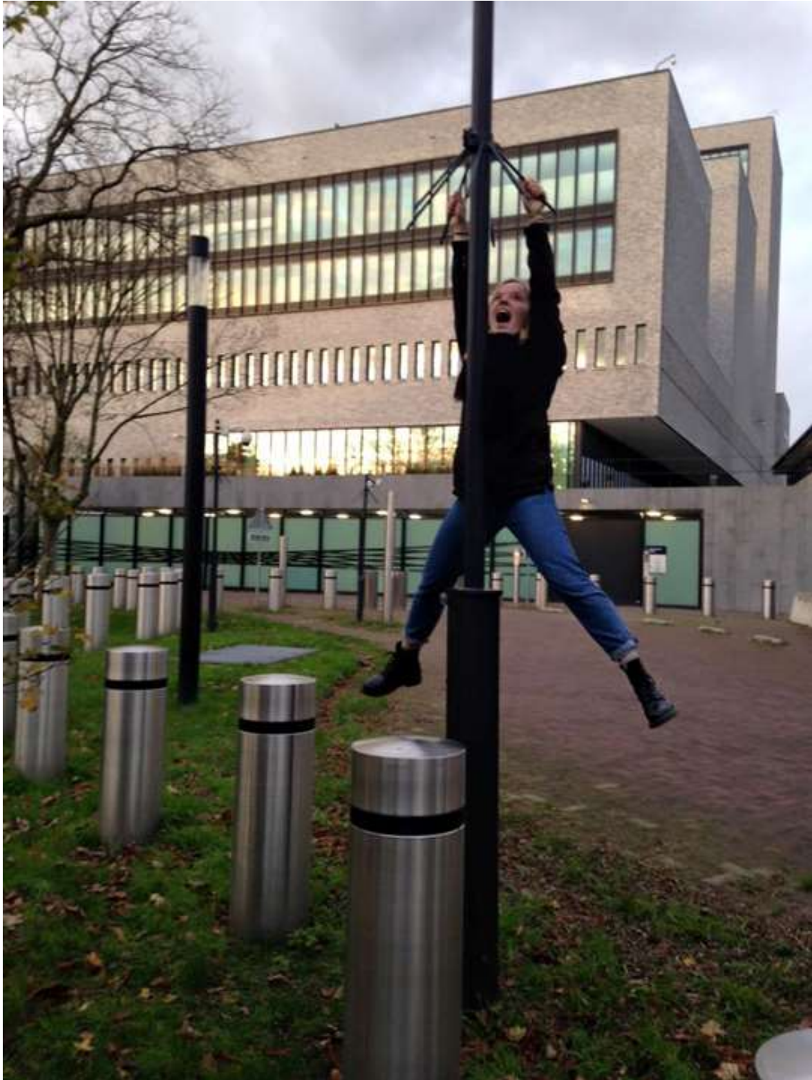
Culture of Control: Live Action Research i.s.m. Platform Scenography