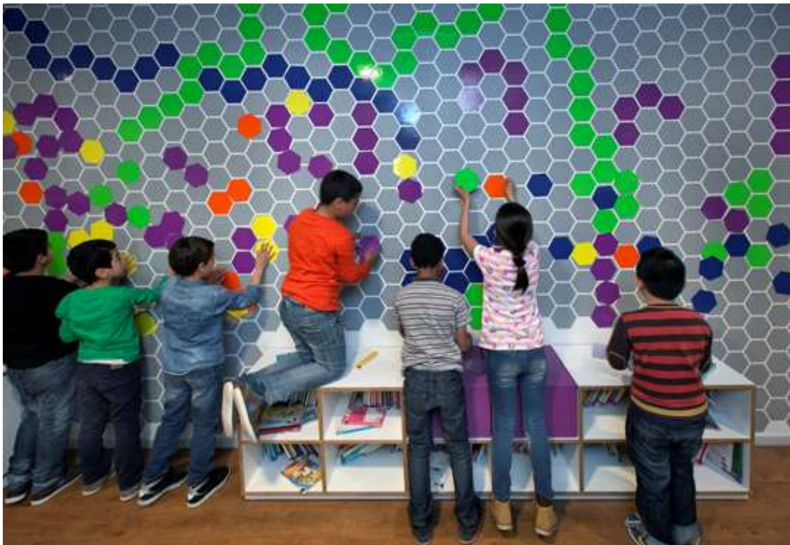
De Design Politie, Boekenworm, schoolopdracht Prof. Mr. A. Anema School