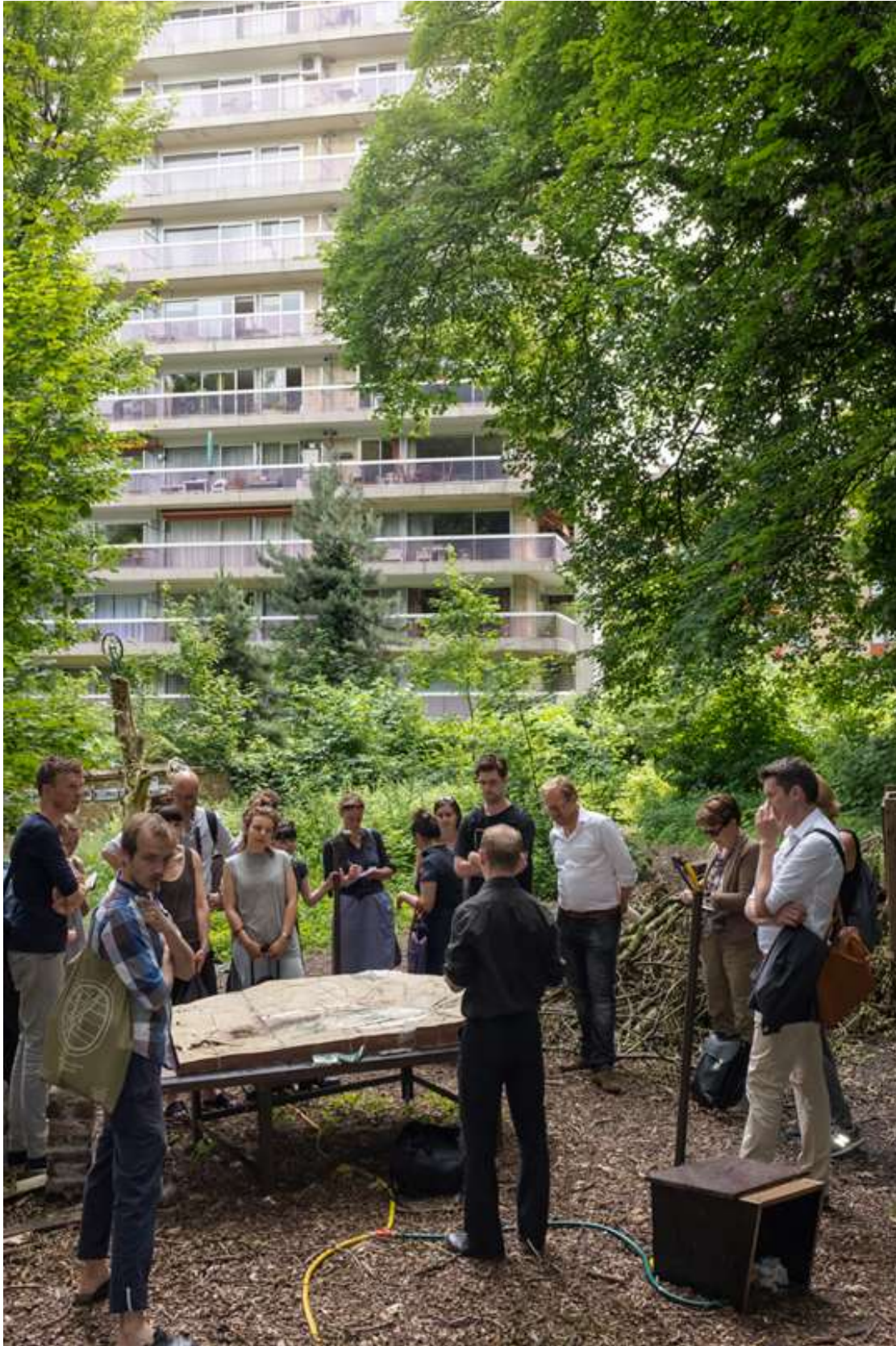
Educatie: Stadsklas Brussel