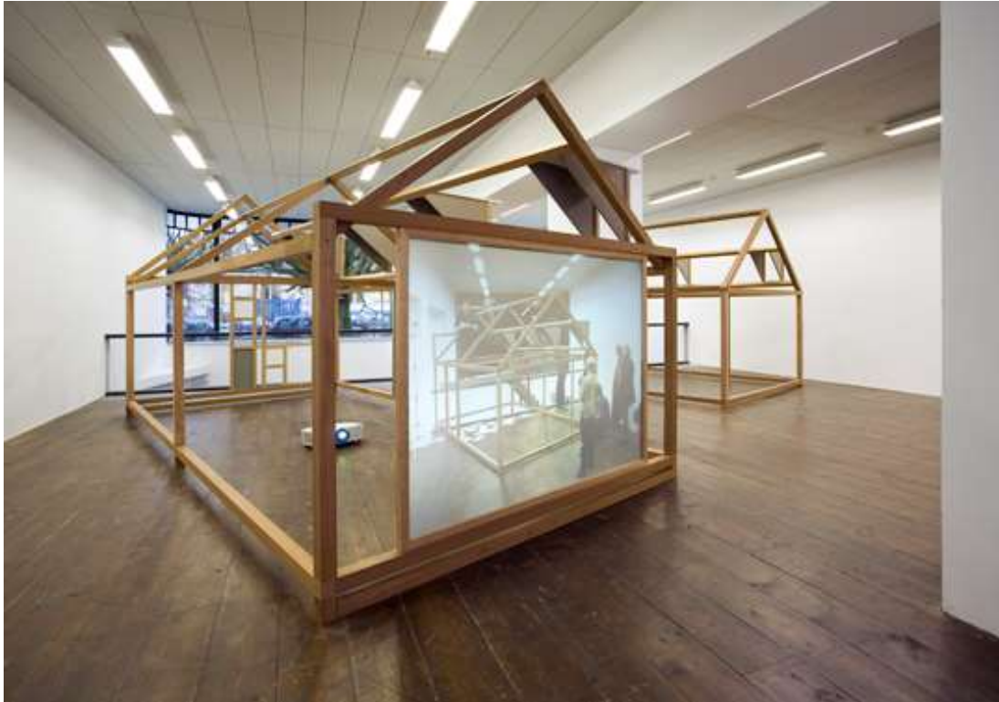
Tentoonstelling Angela Ferreira: Revolutionary Traces