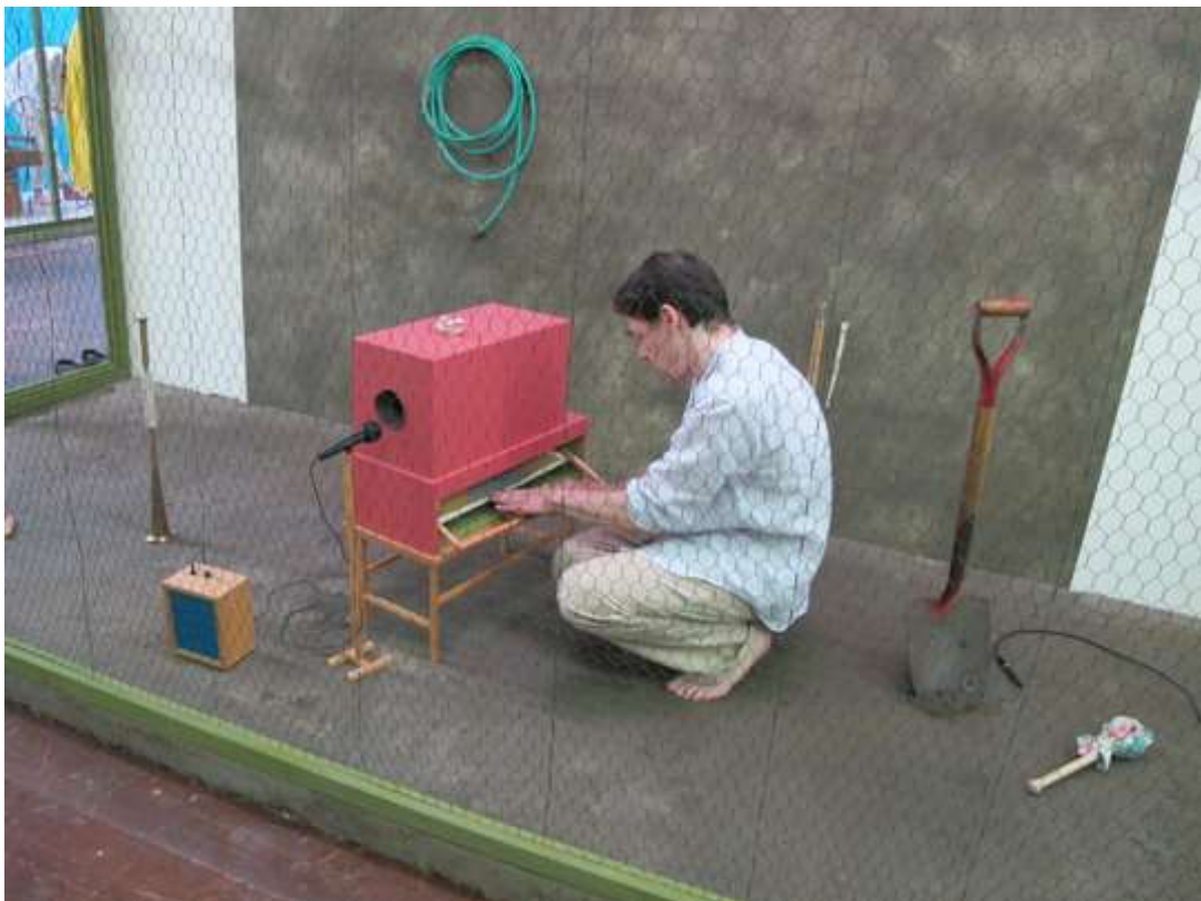
Tentoonstelling Gareth Moore, A Burning Bag as a Smoke-Grey Lotus