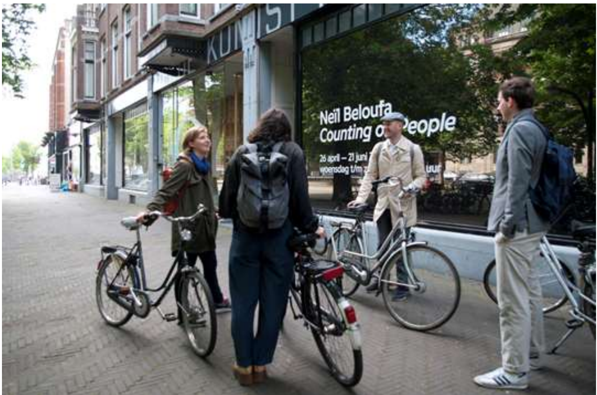
Stroom Invest Week 2015: start fietstocht langs culturele plekken in Den Haag