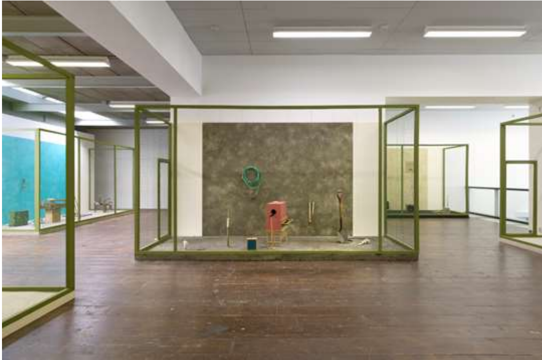
Tentoonstelling Gareth Moore, A Burning Bag as a Smoke-Grey Lotus