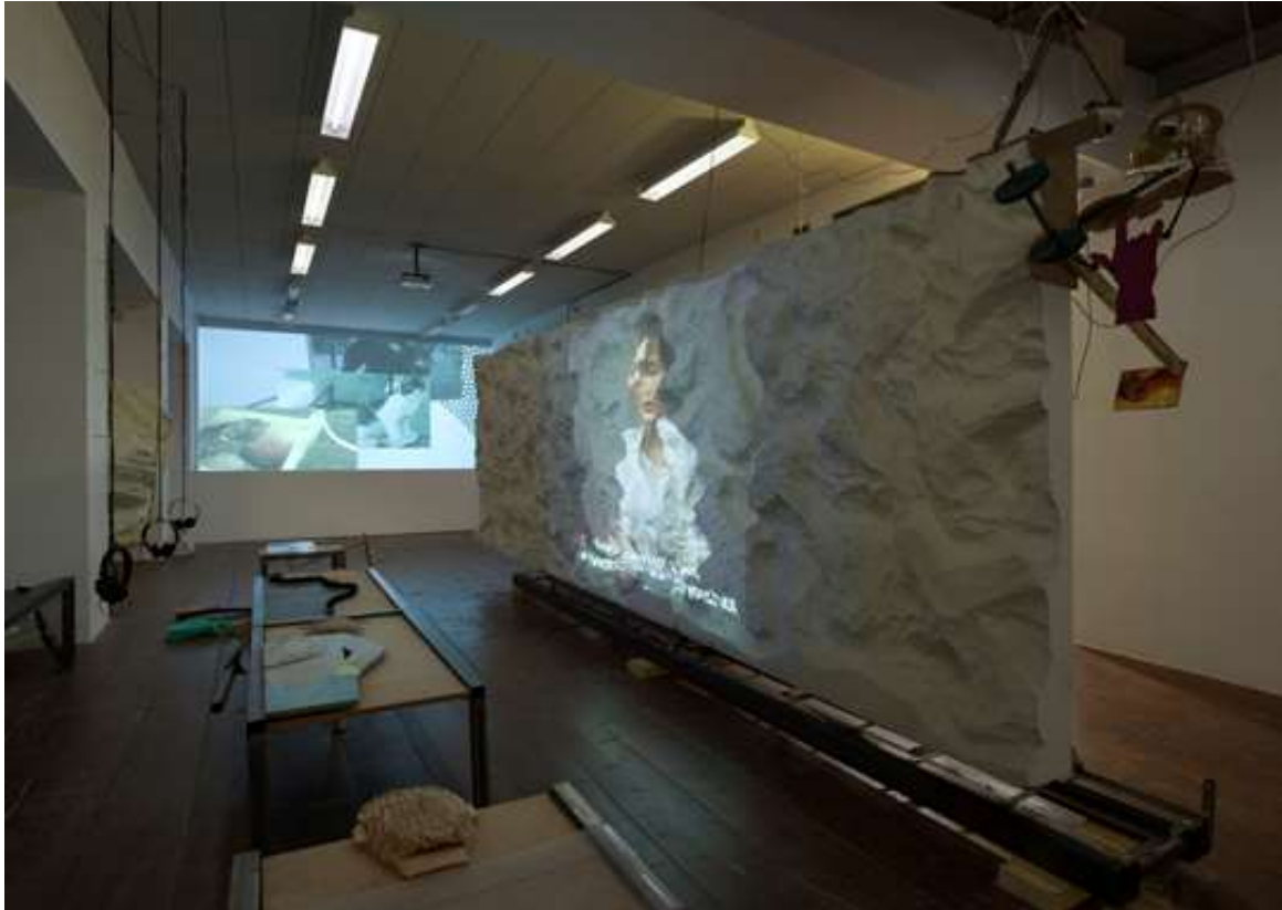
Tentoonstelling Neil Beloufa, Counting on People