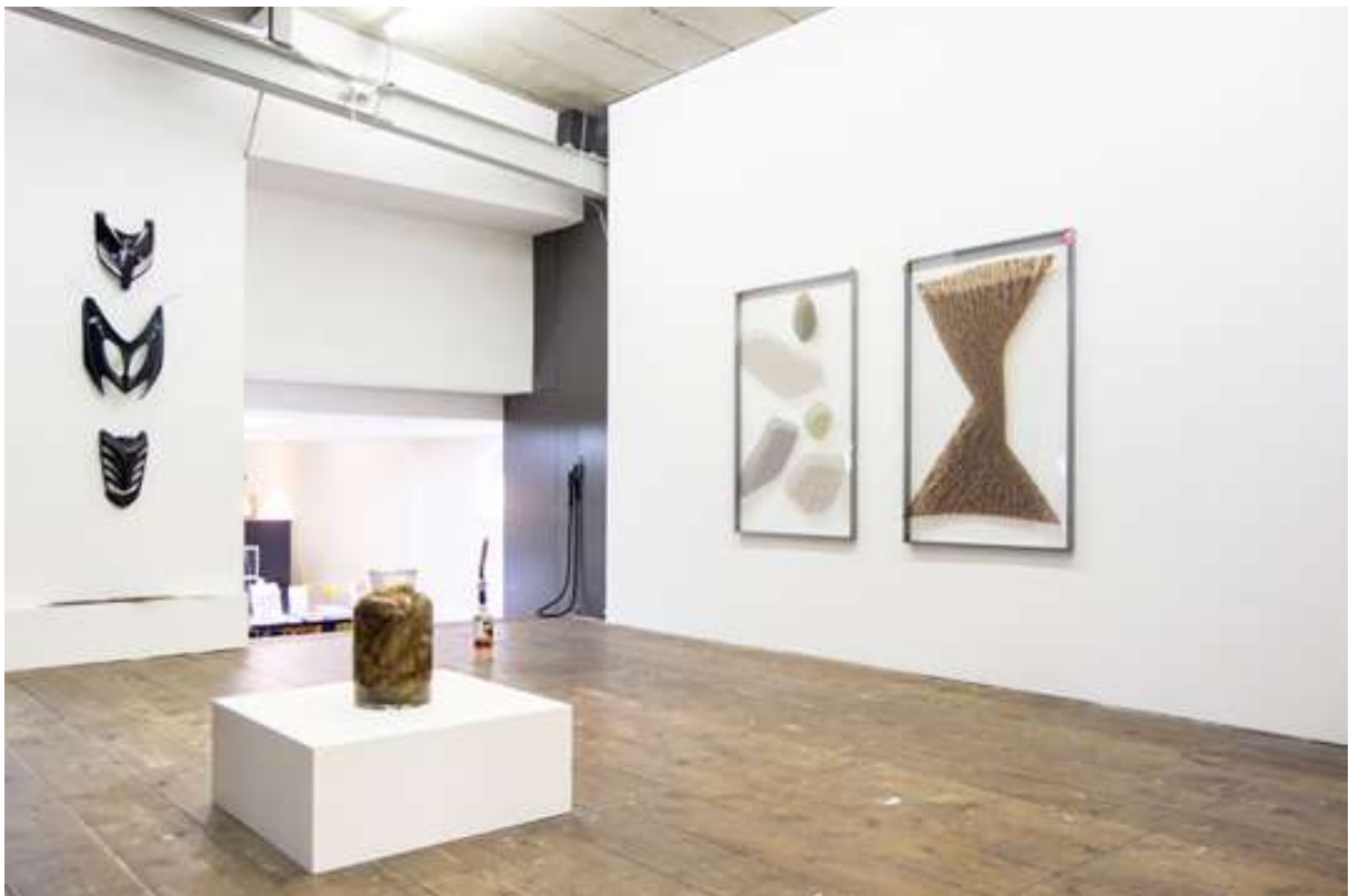
Ondertussen: Thomas van Linge