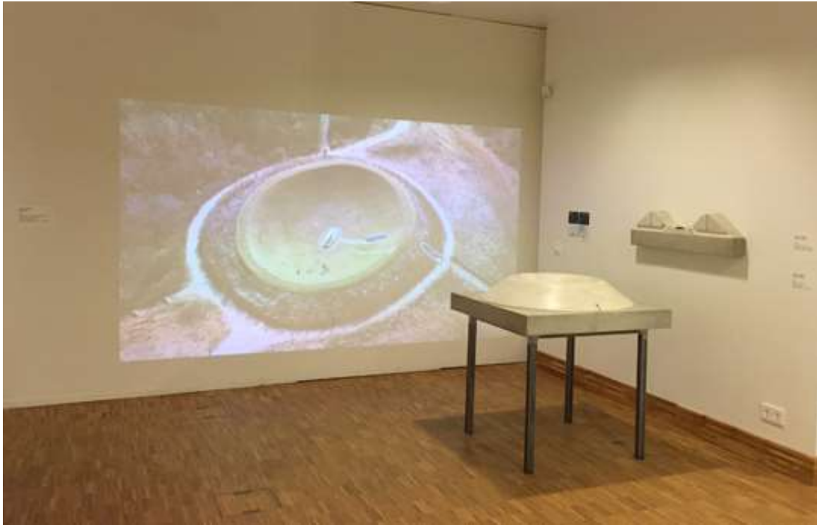
James Turrell, Hemels Gewelf en Roden Crater in de tentoonstelling Expeditie Land Art bij Kunsthal KAdE in Amersfoort