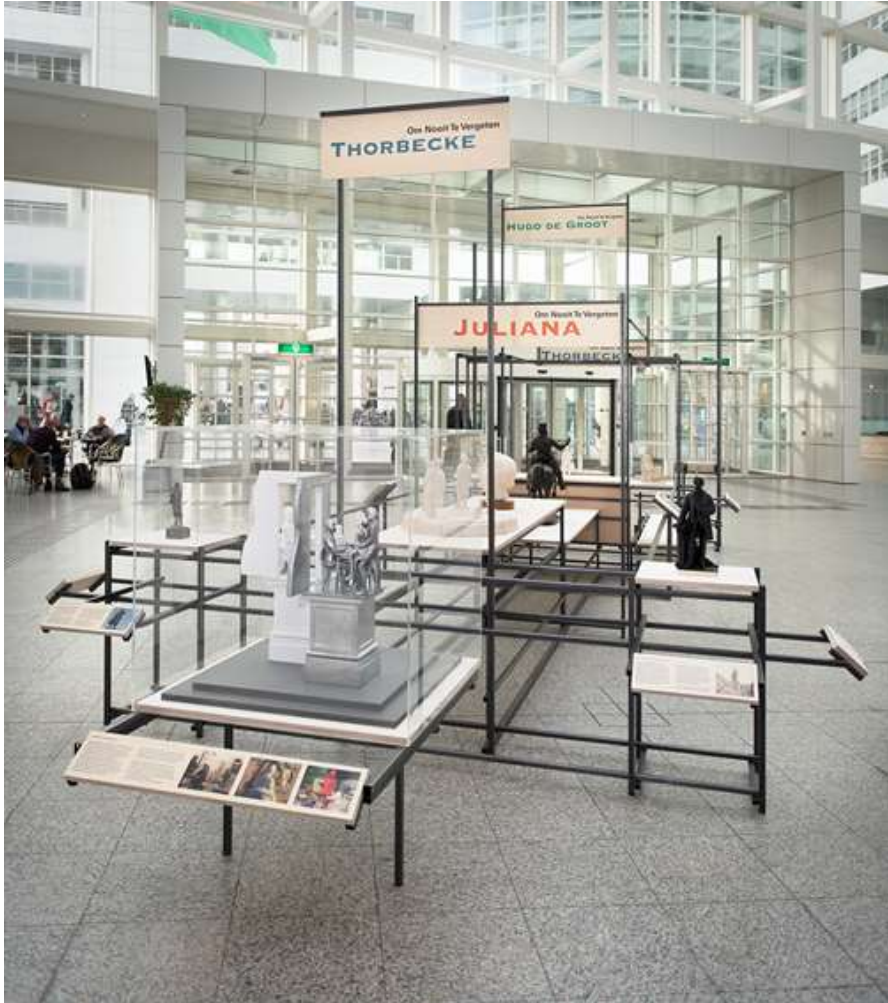
Tentoonstelling Om nooit te vergeten... Welke kleur hebben onze Haagse monumenten?