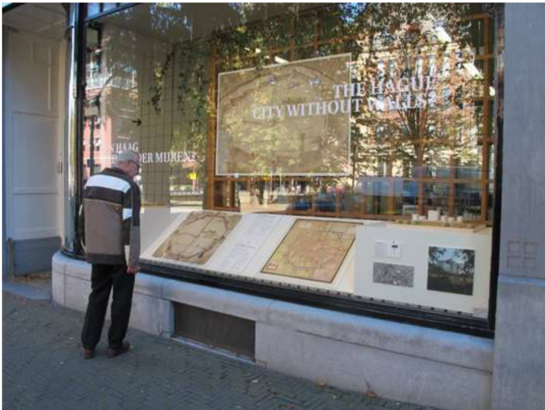
Etalagepresentatie: Den Haag Stad zonder muren van Floris van der Zee