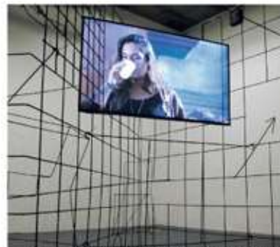
Twee onderdelen van de installatie 'Counting on People' (2011) van Neil Beloufa in Stroom, Den Haag.

En dan begint er bij de toets hoever mensen een machtige tool in het beeld- merk kunnen wanneren die Beloufa's expositie Counting on People in Stroom bezocht. Beloufa's tentoonstelling is niet alleen verbluffend, er staat ook een groot aantal ongemakkelijke, per- sonale wijzigingen die je oortoe een vraag (physisch 'grootgewo' geven. Daar- toem door de meest verschillende vi- deo's. Die zijn natuurlijk het 'nu', waarmee je een klik krigt op de ware