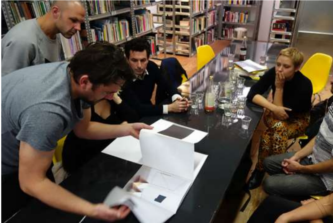
Bibliotheeksessie Marius Lut