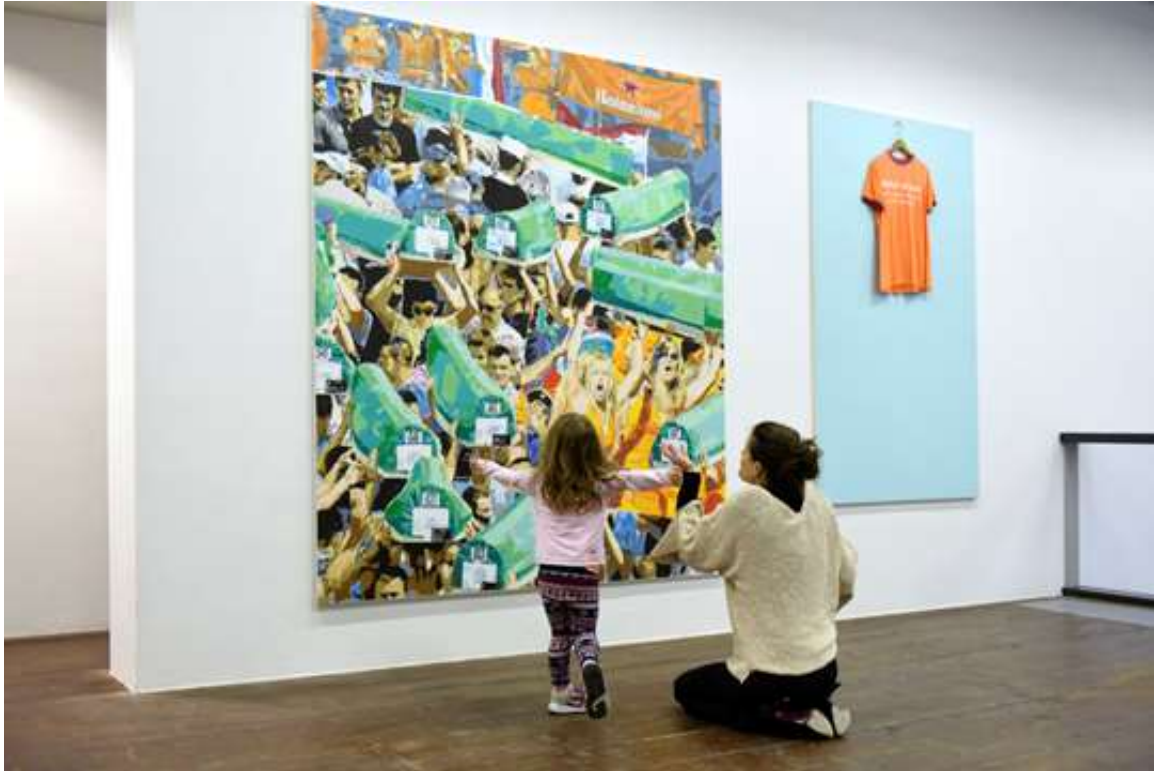
Tentoonstelling A Crushed Image (20 years after Srebrenica) , werk Peter Koole