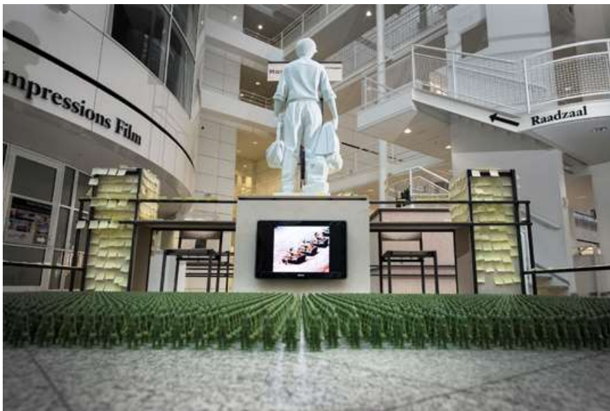
Tentoonstelling Om nooit te vergeten... Welke kleur hebben onze Haagse monumenten? Fernando Sánchez Castillo, Tank Man