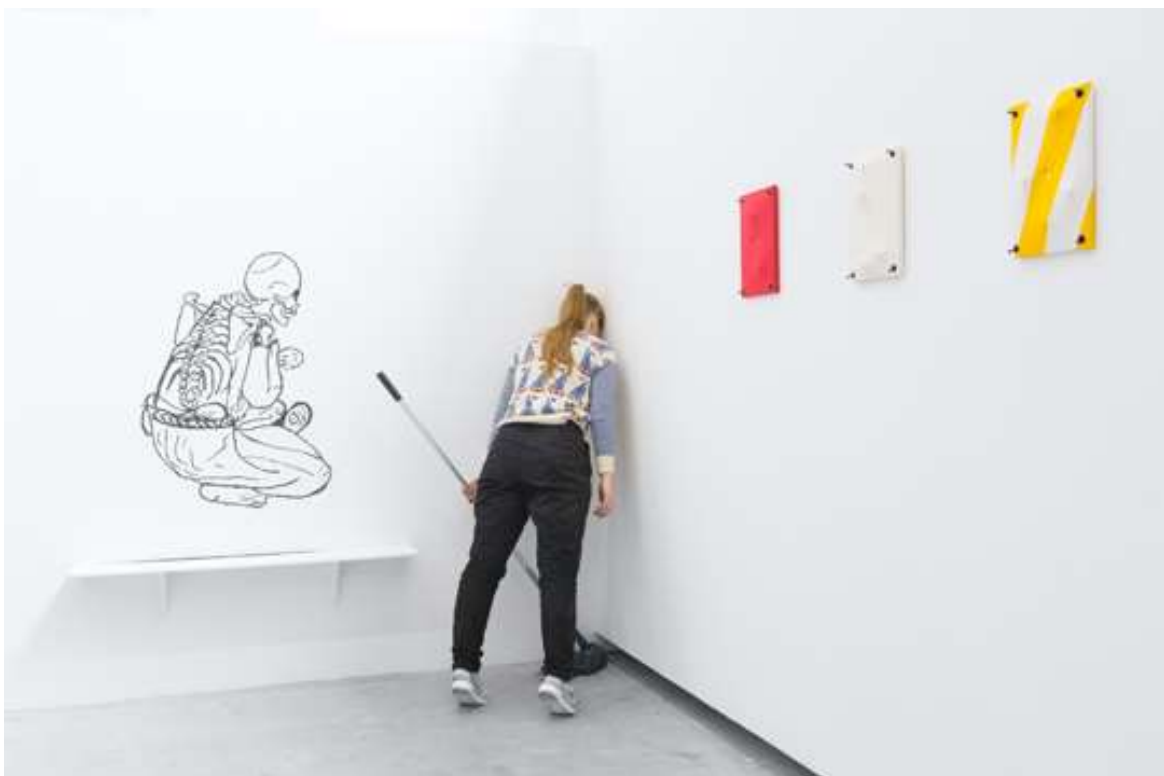
Tentoonstelling A Crushed Image (20 years after Srebrenica) , werk Jason File