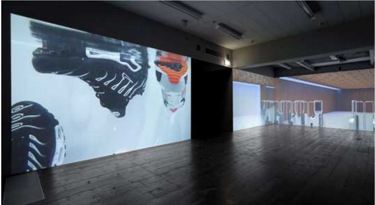
Tentoonstelling SHOW MORE