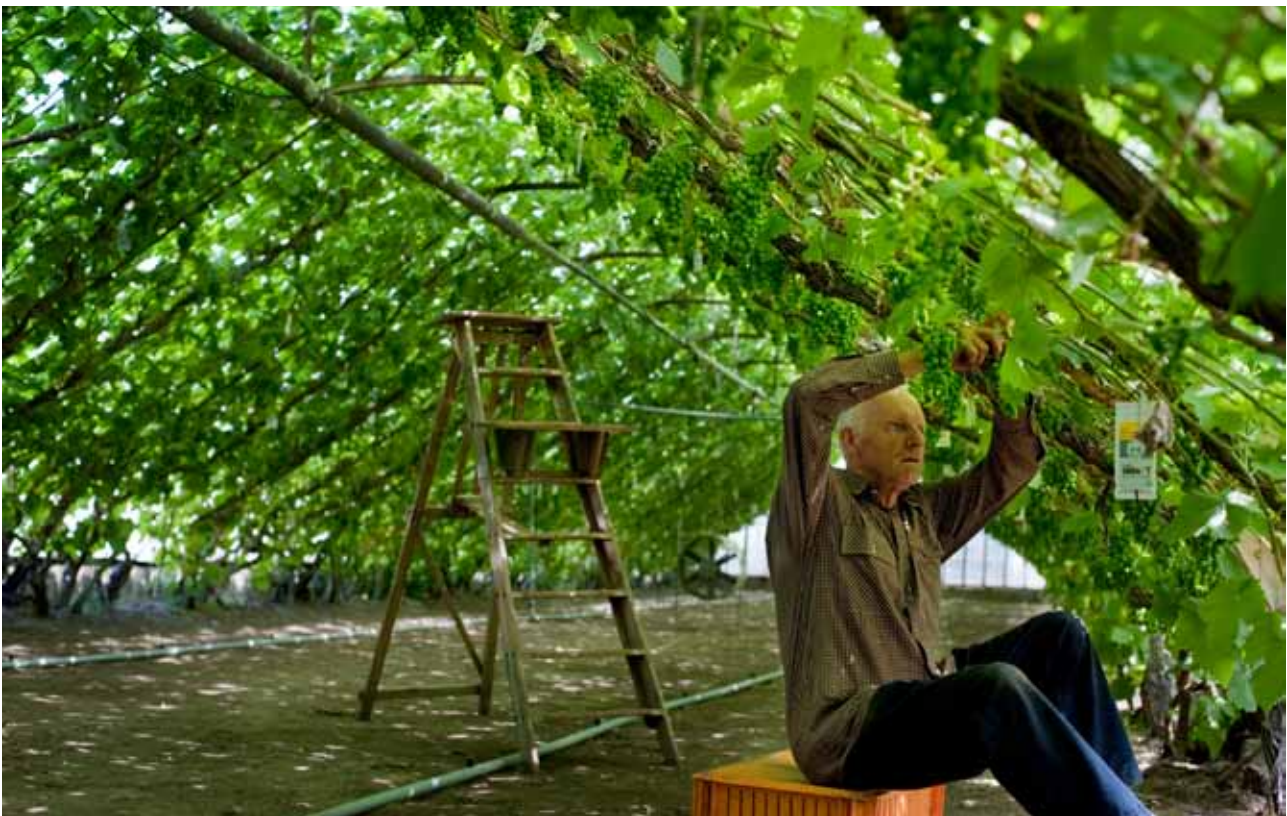
Kwekerij De Sonnehoeck in het Westland

Met name als er weinig geautomatiseerd is, zijn er veel laaggeschoolde werknemers nodig. De toenemende vraag naar arbeid is voor sommige stakeholders het voornaamste belang bij het voedselproducerend systeem. Maar op een werkplek gebeurt meer dan het verrichten van arbeid. Samenwerking kan niet zonder communicatie en om goed te functioneren zijn basale competenties nodig. Die kan deze doelgroep bij het voedselproducerend systeem opdoen. Het bieden van werkplekken voor mensen met een afstand tot de arbeidsmarkt brengt deze doelgroep dus dicht bij de maatschappij. Zie ook het hoofdstuk Sociale cohesie (p. 9).