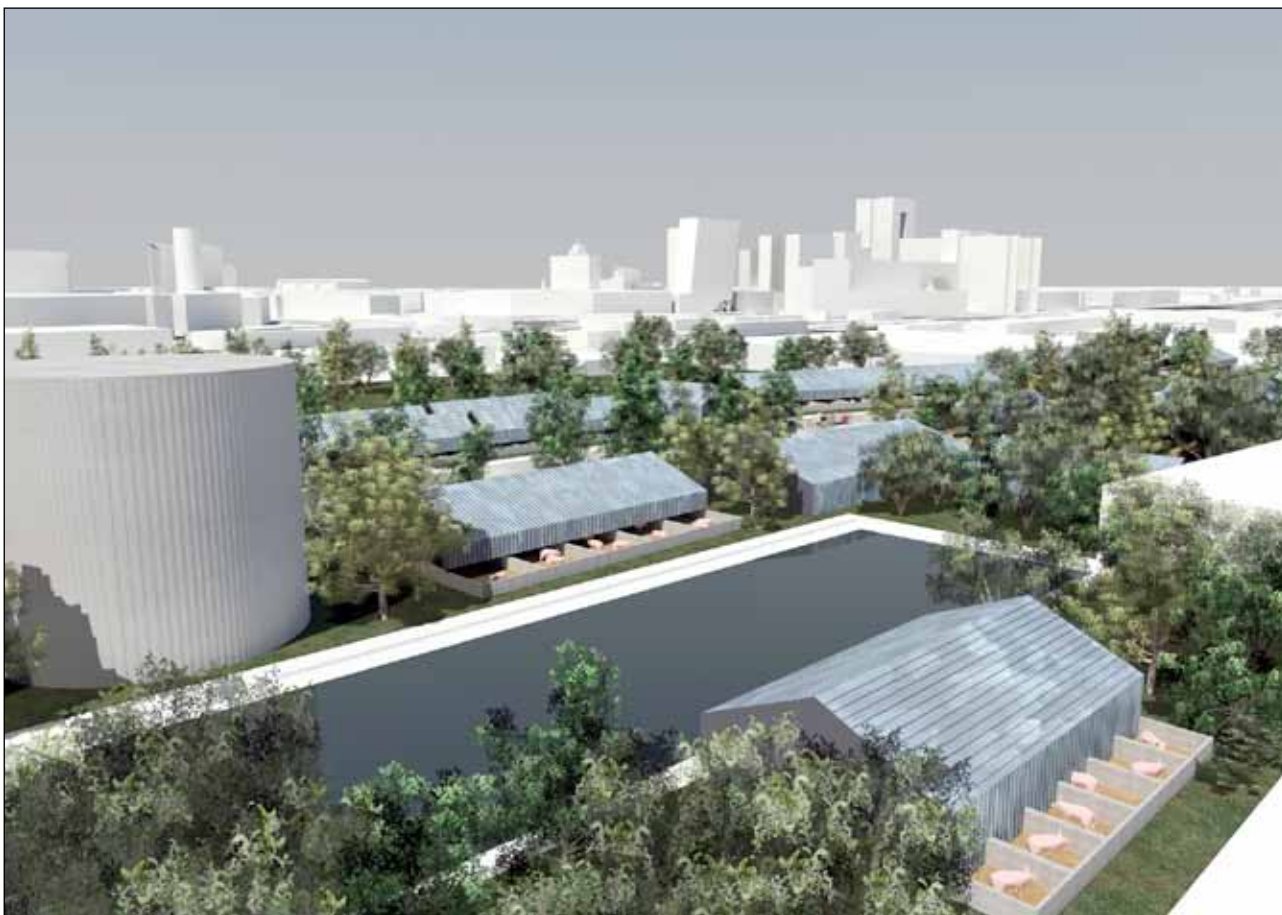
'The District', een van de ontwerpvoorstellen voor een Haagse stadsvarkensboerderij van Winy Maas & The Why Factory

Hoe meer mensen weten hoe voedsel geproduceerd kan worden en hoe we zelfvoorzienend kunnen zijn, hoe beter we weten hoe we moeten handelen bij voedselcrises. Daarom is educatie essentieel. De zogenaamde organiponicos (gemeenschapstuinen) in Havanna zijn een schoolvoorbeeld van wat er op dit vlak mogelijk is als de nood aan de man komt, maar denk ook aan Dig for victory in Engeland tijdens de Tweede Wereldoorlog. De inwoners van London benutten elk stukje grond, tot parken als Kensington Gardens aan toe, om voedsel te verbouwen. Mede hierdoor overleefden ze de oorlog en de blokkade door de Duitse U-boten van de overzeese handelsverbindingen. Zie ook het hoofdstuk Educatie (p. 15).