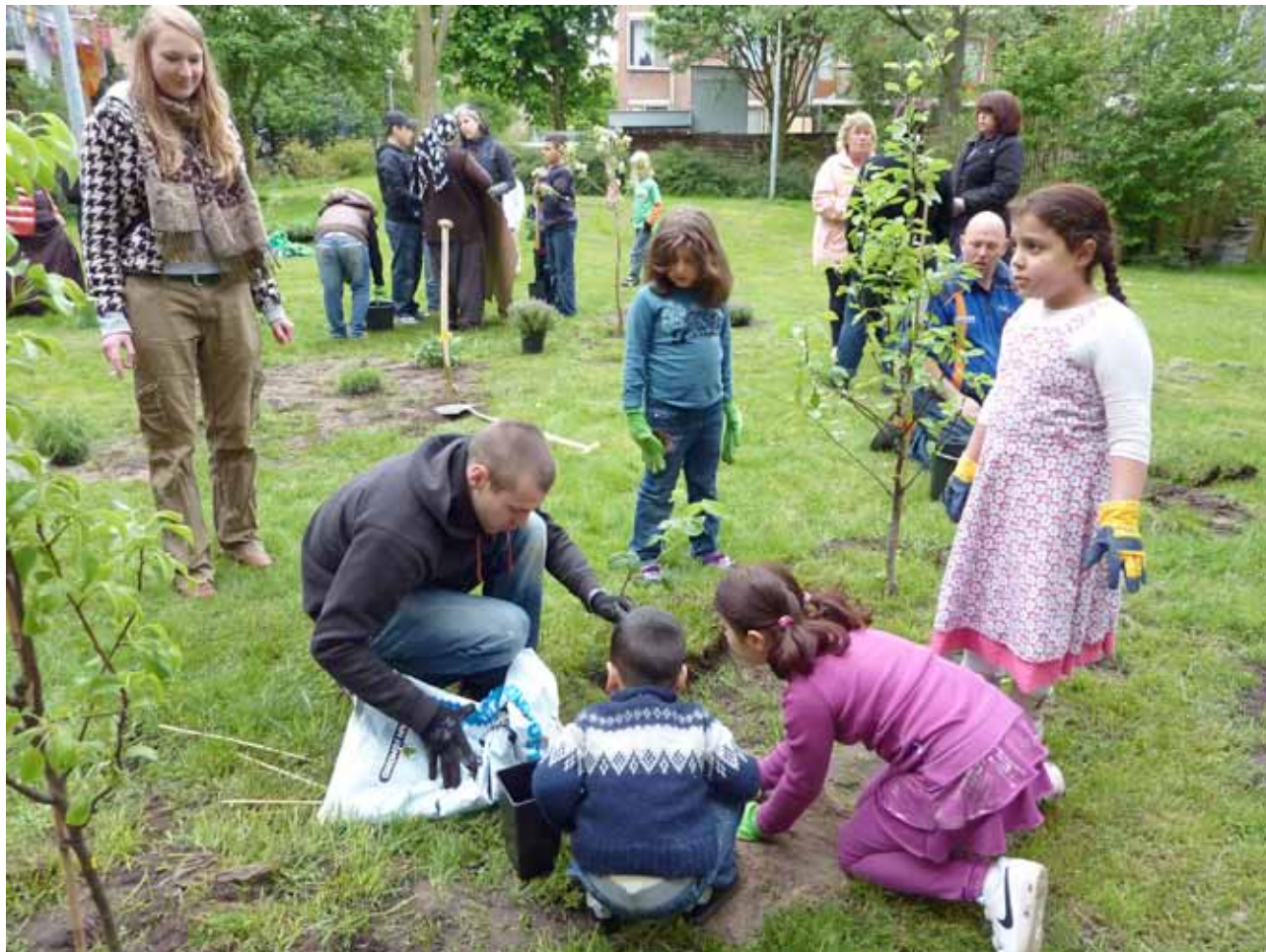
Plantdag met de buurtbewoners van 'Foodscape Schilderswijk'

Hoe kan voedselproductie de behoefte aan recreatie vervullen?