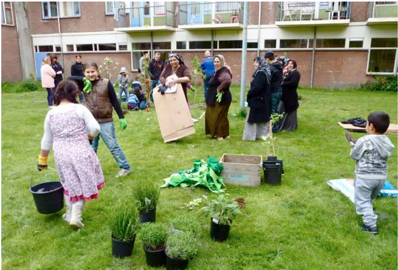
Plantdag met de buurtbewoners van 'Foodscape Schilderswijk'

Hoe kan stedelijke voedselproductie helpen de sociale cohesie te versterken?