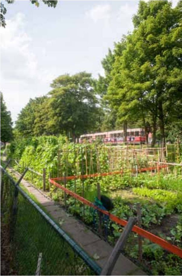
Volkstuinen in Den Haag