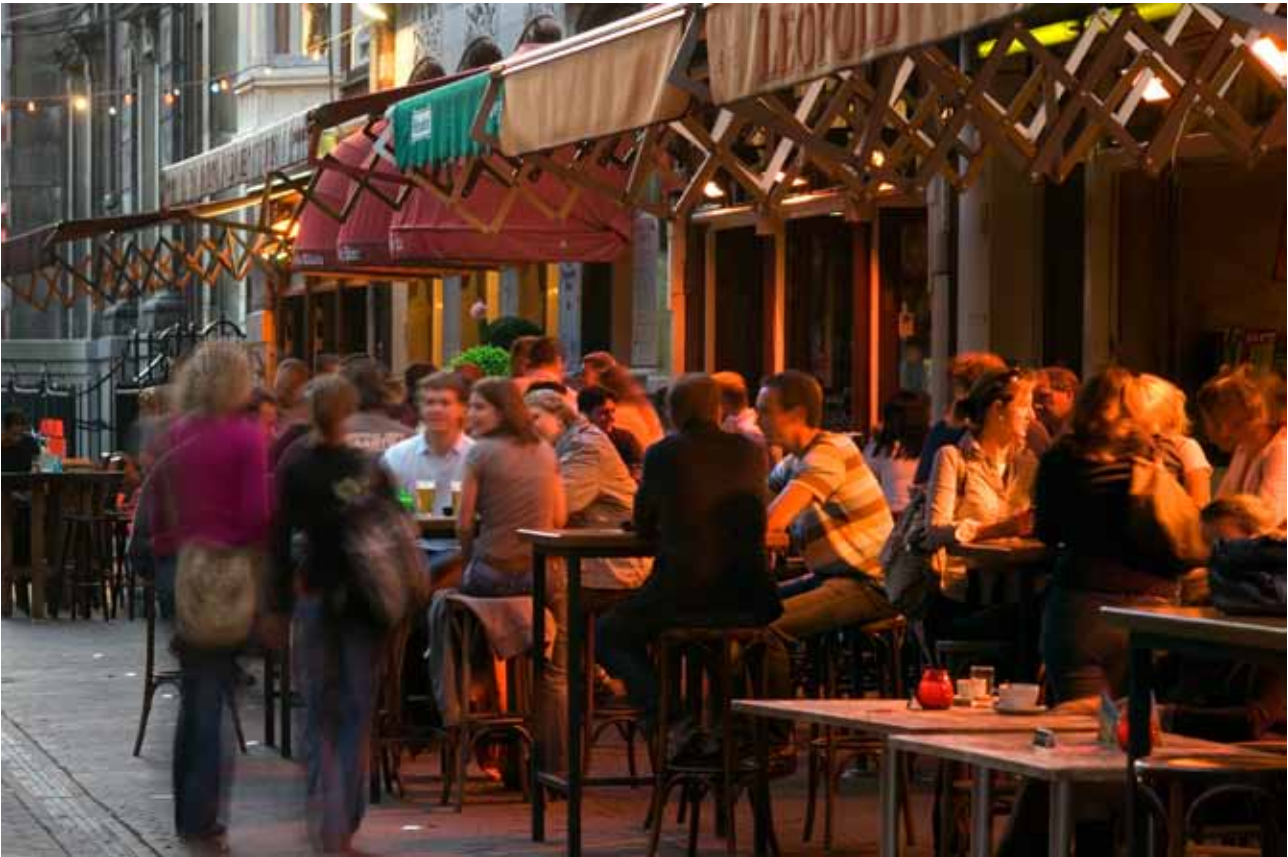
Terras op het Plein in Den Haag