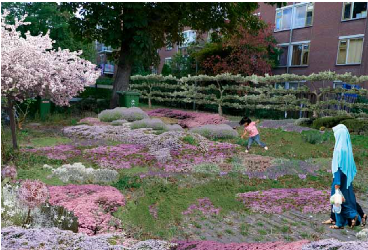
Voorstel kunstproject 'Foodscape Schilderswijk' van Debra Solomon (programma Foodprint, Stroom Den Haag)

Bruggen of de veiling) moeten liggen. Afval dat gegarandeerd vleesvrij is, kan gebruikt worden voor dierlijke voedselproductie. Een varkenshouderij is het meest geschikt, indien men van grote afvalstromen gebruik wil maken. Stedelijk (huis)afval kan ook gecomposteerd worden voor gebruik in het voedselproducerend systeem, om te gebruiken als bodemverbeteraar. Daarnaast verkleint ketenverkorting en lokale productie de behoefte aan verpakkingen, die zowel energie behoeven voor de productie als voor de verwerking na gebruik.