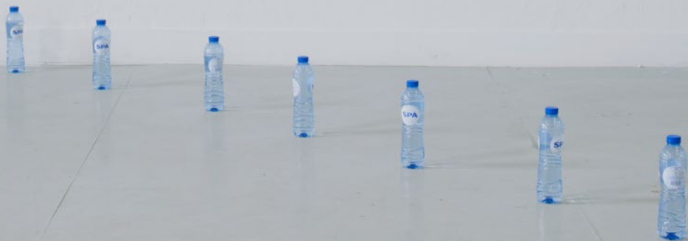
Voebe de Gruyter, The water of the jury of the Queen Elisabeth competition (2015), kleurpotlood, potlood, aquarelverf op papier, tekening en spaflesjes.