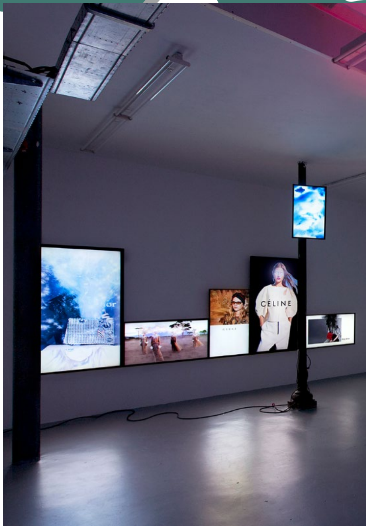
► Juliaan Andeweg, Boreas (2016), installatie Rijksacademie-OPEN, Amsterdam.