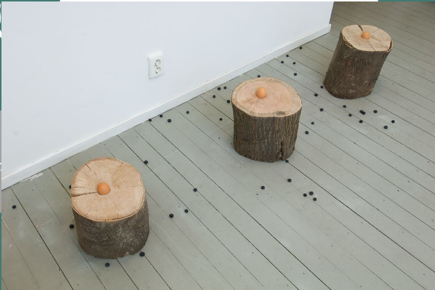
Voebe de Gruyter, The Game of the Baldheads (2010), hout, eieren, blauwe bessen. Variabele afmetingen.