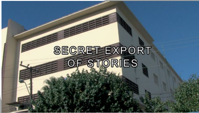
Voebe de Gruyter, Secret Export of Stories (2009), video (still).