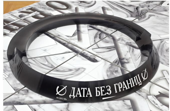
Large Data Collider , 2013

Ontwerp- en onderzoeksstudio Metahaven reflecteert in hun werk veelvuldig op de sluiers van authenticiteit die onze steeds verder polariserende geopolitieke en technologische landschappen domineren. Hun meest recente projecten draaien om een fenomeen dat zij 'black transparency' noemen: een methode die klokkenluiders en hackers aanwenden om transparantie af te dwingen bij natiestaten en organisaties. Black transparency initiatieven zijn amorf en voeren een soort geïmproviseerde dans uit om te overleven langs de randen van de juridische en politieke structuren van de entiteiten die zij tegen het licht houden. Deze initiatieven vinden tijdelijk onderkomen in rechtsencaves, waarbij zij datahavens opzetten die hen voor een beperkte tijd toestaan om data uit te wisselen. Paradoxaal genoeg wordt hun strijd voor transparantie dus gevoerd in combinatie met doelbewuste pogingen zich verscholen te houden. Volgens Metahaven is