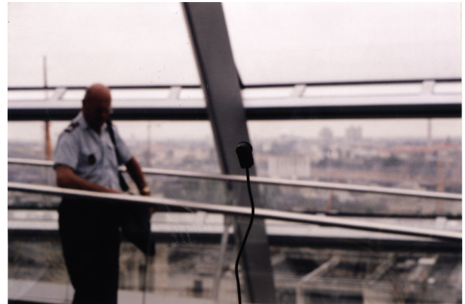
play:display , 2000-2014

In beide gebouwen speelt glas een hoofdrol. In het Rijksdaggebouw symboliseert de glazen koepel een nieuwe en radicale uitdrukking van democratie, terwijl de specifieke transparantie van het Sony-Center een 'culturele eigenschap van een nieuw millennium' verbeeldt. Of het nu om transparante gebouwen of transparantie in het openbare leven gaat, transparantie is tegenwoordig synoniem voor democratie, toegankelijkheid en verantwoording. Maar wanneer men de akoestische eigenschappen van glas analyseert,