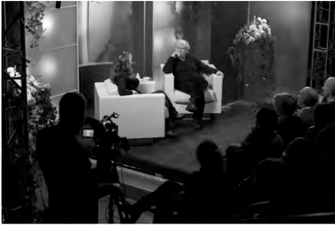
Talk Show - A Platform Commission co-produced by Arts Contemporary Israel Art Fund, ESSE-Russ House for Media Arts, Oberburg and The Clavie Institute, Hong Kong 2009 CAPTION INFO: DO NOT PRINT