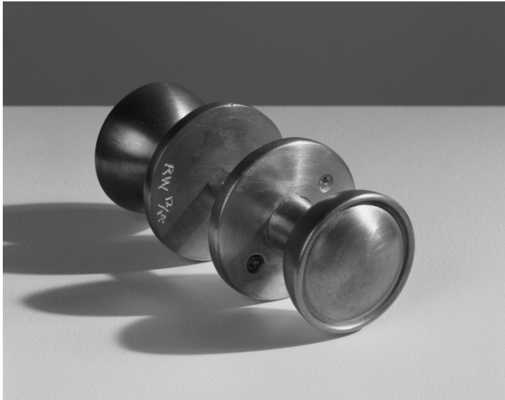
Rachel Whiteread, UNTITLED (DOORKNOB II) (1993/2003).