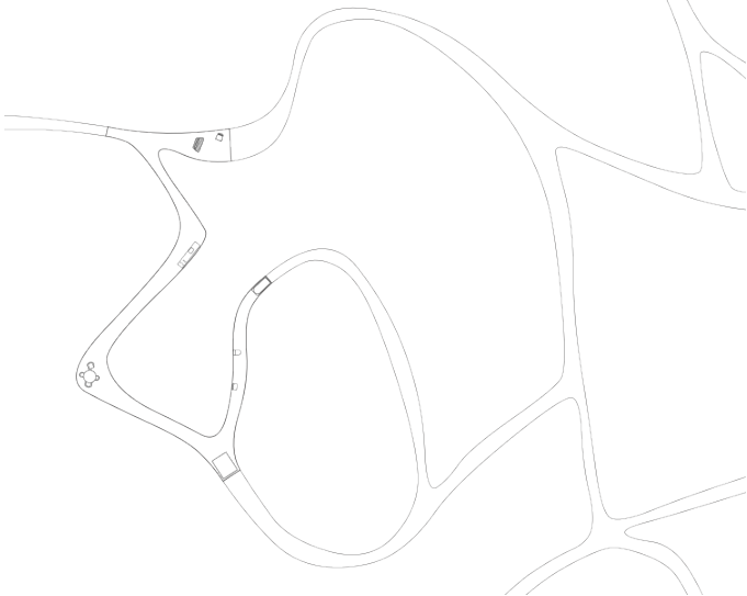
Anne Holtrop, TRAIL HOUSE (2009).