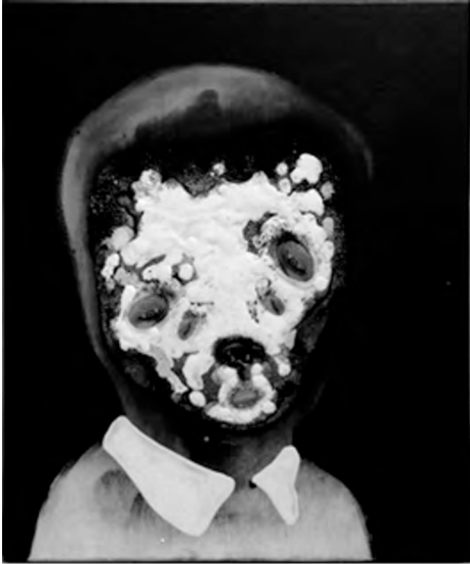
Vittorio Roerade, MASK (2008).