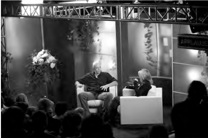
Talk Show - A Platform Commission co-produced by Arts Contemporary Israel Art Fund, ESSE-Russ House for Media Arts, Oberburg and the Clavie Institute, Hong Kong 2009 CAPTION INFO: DO NOT PRINT

Omer Fast, screenshots TALK SHOW (2009).